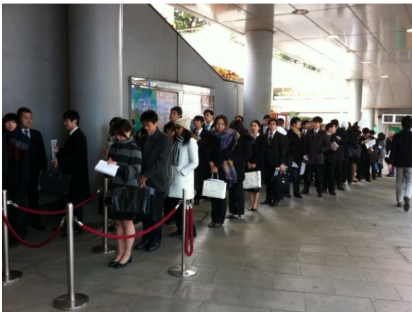
イベント開始前、会場外に列をなす外国人留学生達